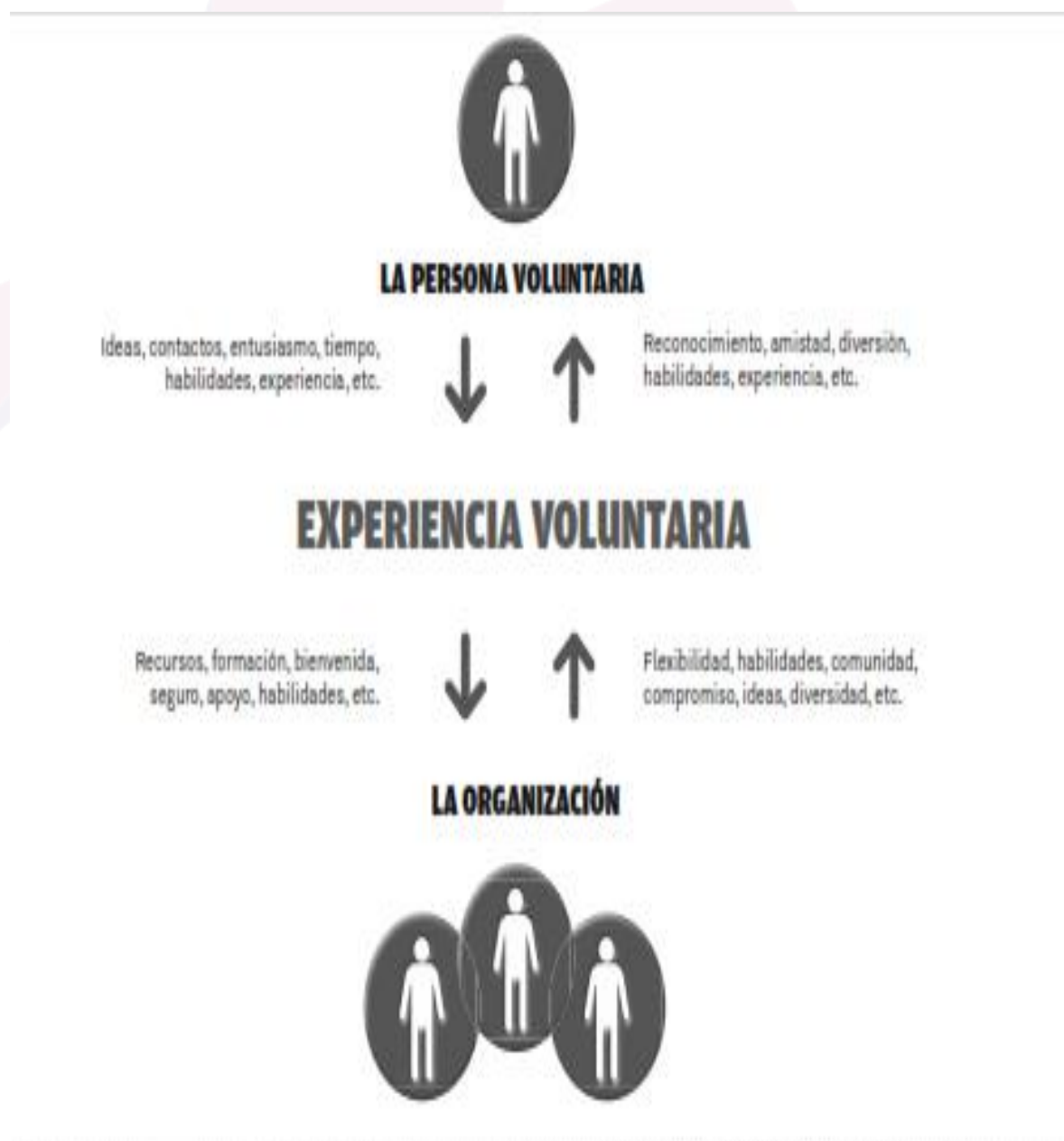
Figura I. La Experiencia Voluntaria

El voluntariado es el pilar fundamental dentro del funcionamiento de la Fundación. Uno de los objetivos fundacionales prioritarios a este respecto, es conseguir implicar al personal voluntario en la mayoría de los servicios que presta, a través de una oferta variada de actividades, donde se produzca un enriquecimiento mutuo que repercuta directamente en la calidad de vida de la persona con discapacidad.